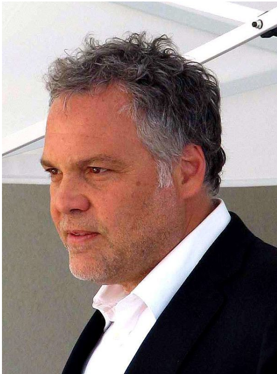
Vincent D'Onofrio spielt Wilson Fisk, den Antagonisten der ersten Staffel.