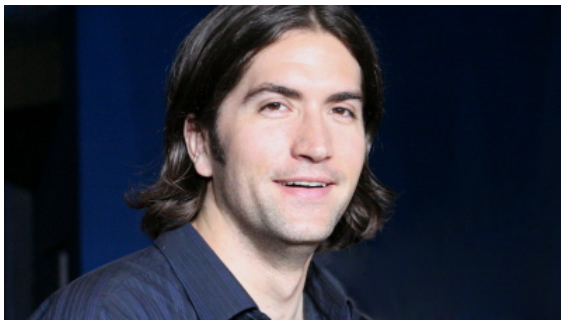
Serienschöpfer Drew Goddard