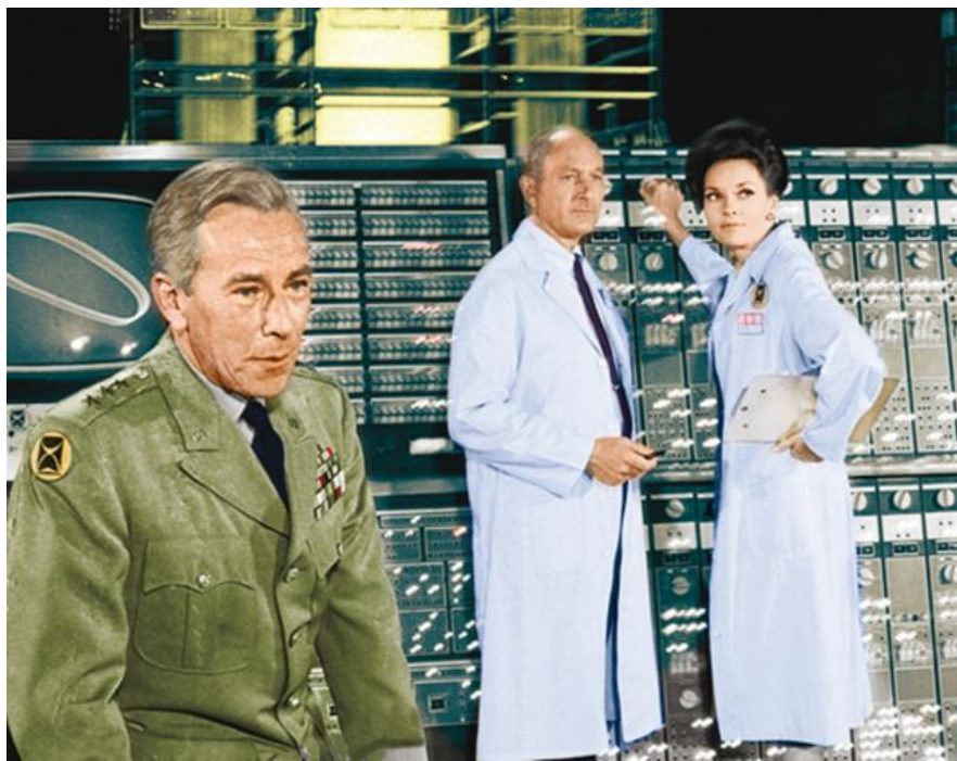
Drei-Sterne-General Heywood Kirk, gespielt von Whit Bissel (links im Bild)

Muss ich noch sagen, dass die DVD-Hülle mit einem coolen 3D-Cover ausgestattet ist, um euch zum Kauf dieser schönen Neuedition zu verführen?