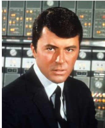
Tony (James Darren)