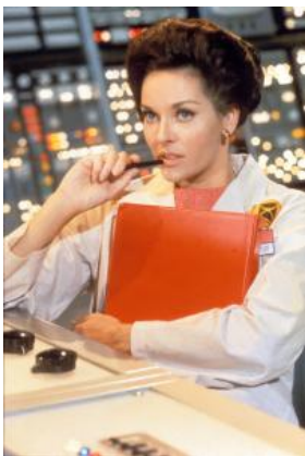
Dr. Ann MacGregor (Lee Meriwether)