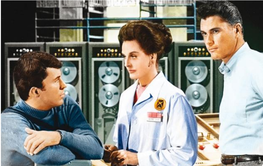
Die Hauptdarsteller der kultigen Serie: Tony (James Darren), der Pulloverträger, Dan (gespielt von Robert Colbert) und natürlich Dr. Ann MacGregor (Lee Meriwether), die im Labor ausharren durfte