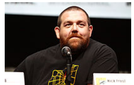
Schauspieler Nick Frost